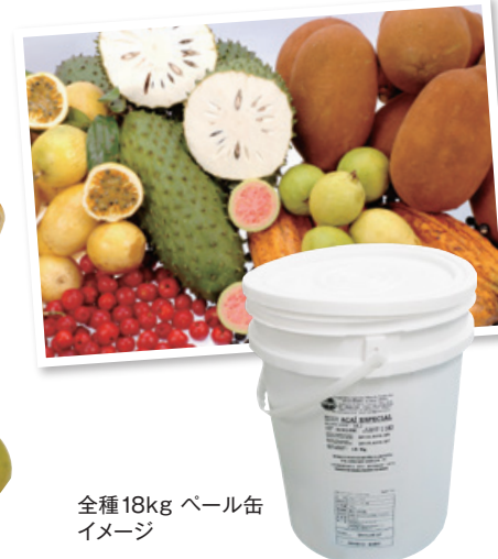
全種18kg ペール缶イメージ